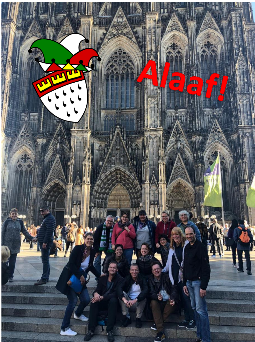
Wiehlmys in Köln