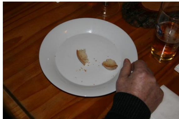
Und das isch im Obmaa sy Däller.