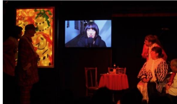
Oh Schregg! Totalussfall!

Au anderi Kinder hän in däm Joor ihr Bühnedebut dörfe fyyre, ihr hand das alli grossartig gmacht, härzligi Gratulation!