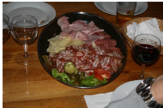
Das isch uus dr Kuchi koo