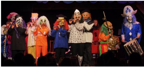
dr 1. Ufdritt mitm Arabi

In der Fasnachtsbaiz vom Roosi gits laider nid s'beschte Fasnachtsässe für uns als «Rooti Röppli». Troztdäm simmer mit vollem Elan drbi gseh am dsjöörige Fasnachtsbändeli. In däm Joor mit speziell viel Fasnachtsmusik und au tolle Kinderschnitzelbängg, wo e mängge Erwaggsene zum Lache brocht hän.