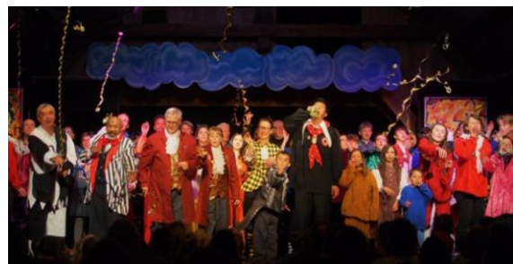
«...mir wärfe euch, mir wärfe euch e Fasnachtsbändeli a!»

Mir gsehn is näggscht Joor, wens wieder haist: